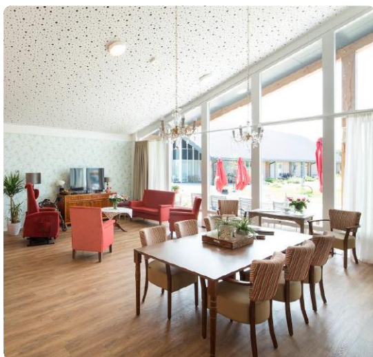
interieur van de 'rode boerderij'.

Deze zomer is ons project De Eemhorst in Soest gefotografeerd. Dit project is in het 3e kwartaal 2017 opgeleverd, en bestaat uit een woonzorgvoorzieningen voor ouderen met geheugenproblematiek. De woonzorgvoorziening bestaat uit 3 gebouwen, waar in totaal 27 appartementen met voorzieningen zijn gerealiseerd. Uitgangspunt hierbij waren de principes van het 'kleinschalig wonen', in het bijzonder gericht op ouderen die affiniteit hebben met het buitenleven.