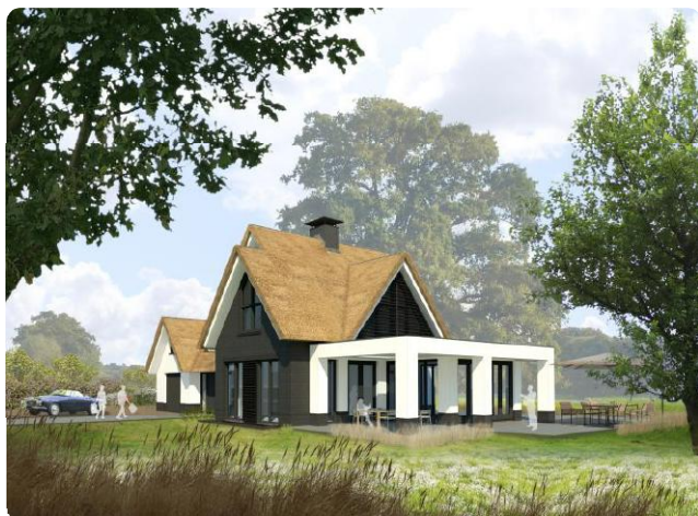
Artist Impressie nieuwbouw

De uitvoering van de villa op een ruim bosperceel aan de Prinschenlaan in Bilthoven vordert gestaag. Het ontwerp heeft de uitstraling gekregen van een modern landhuis met rieten kap. De bouw is in Januari gestart, bouwbedrijf AtB uit Leerbroek heeft de uitvoering ter hand genomen. De komende weken zal de kap geplaatst worden, en kan de rietdekker starten met zijn werkzaamheden. Naar verwachting wordt het project in Januari 2019 opgeleverd.