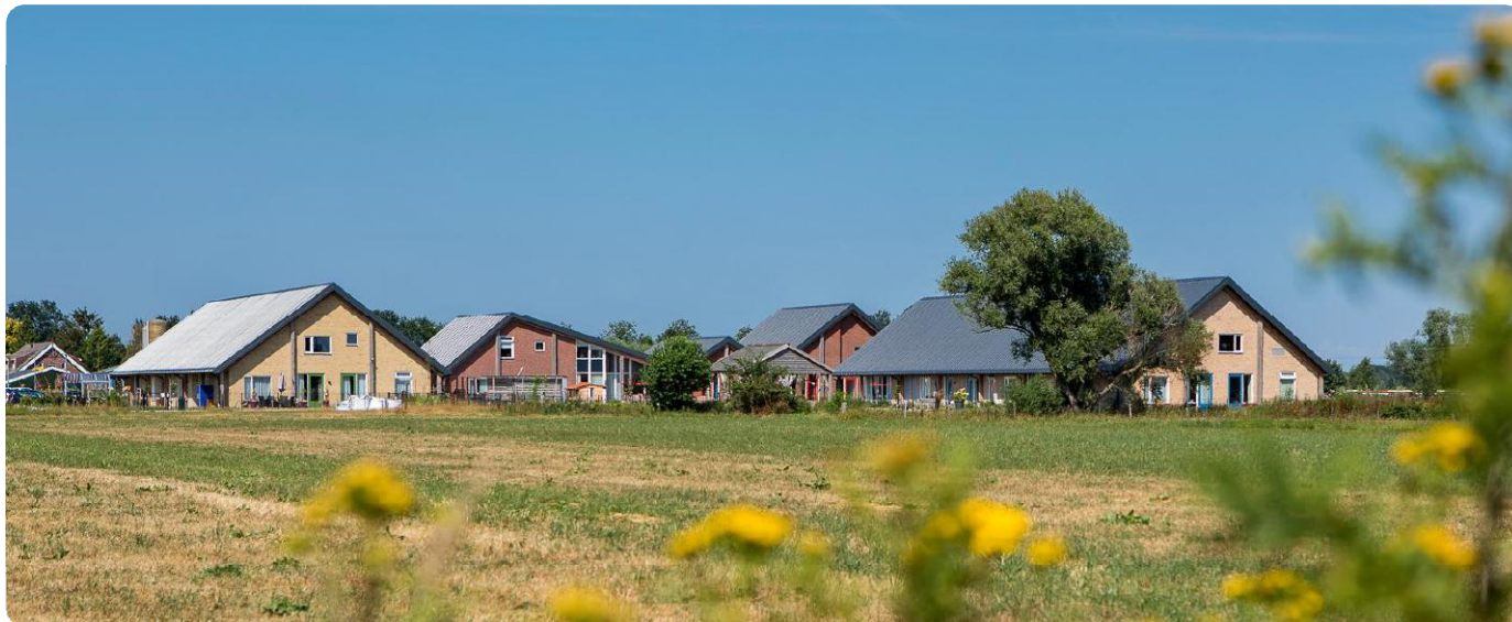
De gerealiseerde gebouwen voegen zich mooi in het agrarische landschap