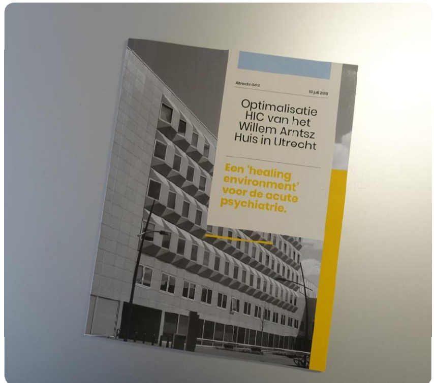
Het gepresenteerde magazine 'Een healing environment voor de acute psychiatrie'.

Ter Braak Architecten heeft samen met Studio id+ het structuurontwerp gemaakt voor Optimalisatie HIC van het Willem Arntsz Huis in Utrecht. Het betreft de vier verdiepingen van de High & Intensive Care (HIC). De HIC is de acute opname afdeling voor ernstig verwarde mensen en is gehuisvest in het Willem Arntszhuis aan de Lange Nieuwstraat te Utrecht. Voor dit project hebben wij zes workshops georganiseerd, waar oa. de zorgmedewerkers en patiënten-vertegenwoordigers in geparticipeerd hebben. Uit deze bijeenkomsten hebben wij een visie ontwikkeld hoe een omgeving te creëren die erop gericht is om het welzijn van patiënten, familie en medewerkers te vergroten en spanning te verminderen. De analyse en het structuurontwerp zijn verbeeld in het magazine 'Een healing environment voor de acute psychiatrie' dat op 10 juli gepresenteerd is.