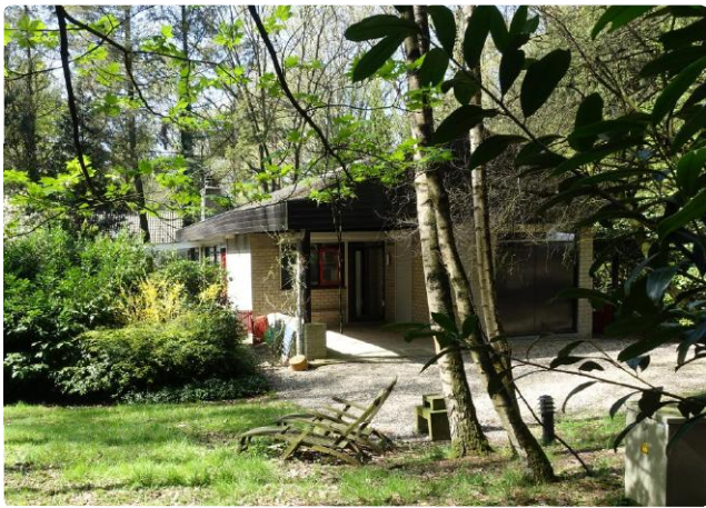
De oorspronkelijke recreatiewoning uit de jaren zeventig.

Ter Braak Architecten heeft een ingrijpend verbouwingsplan gemaakt voor een vakantiewoning in Bennekom. Het sterk verouderde vakantiehuisje, gebouwd in de Jaren 70, is gelegen op een prachtig groen vakantiepark. De opdrachtgevers wensten een modern vormgegeven vakantievilla, met een eigentijdse uitstraling. Door de introductie van 2 witte 'schijven' die het dak aan de kopzijde inpakken, is een compleet nieuwe uitstraling ontstaan. Doordat deze 'schijven' ook het nieuwe terras begrenzen, ontstaat een ruimtelijke opzet. Het terras lijkt te zweven boven het geaccidenteerde terrein. De kleurstelling is zo gekozen dat het mooi contrasteert met de groene omgeving.