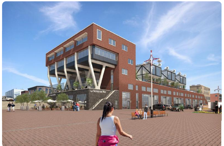
Bedrijfshuisvesting met maritieme uitstraling

Onze plannen voor het project Scheveningen kade haalde het nèt niet, maar wij zijn trots op het ontwerp dat we voor deze locatie gemaakt hebben. De gemeente Den Haag heeft voor het sluitstuk van de ze haven in Scheveningen, de Lelykade, een tender uitgeschreven. Deze locatie moet voor 100% bebouwd worden met voornamelijk lokale bedrijfsfuncties. Ons plan voorziet in ca. 5.700 m 2 bvo, bestaande uit bedrijfshuisvesting, kantoren en horeca. Daarnaast zijn op het dak nog eens 88 parkeerplaatsen gerealiseerd. Het complex moet mooi passen in de haven, en een èchte maritieme uitstraling krijgen. Ter Braak Architecten heeft de plannen in opdracht van, en in samenwerking met PIKE Vastgoed uit Utrecht ontwikkeld.