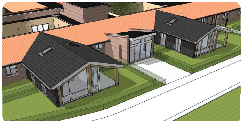
ontwerp uitbreiding woonkamers Poelzijde