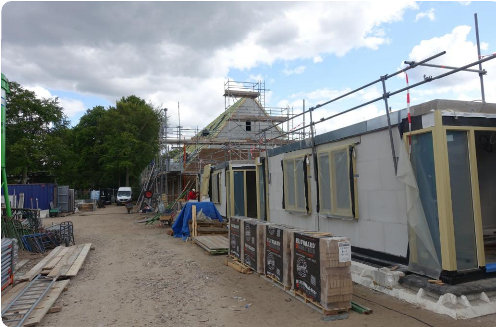
Uitvoering is in volle gang

In mei is het hoogste punt van dit project bereikt. Door de coronacrisis kon dit niet groots gevierd worden, maar wellicht wordt dit bij de oplevering goed gemaakt! Bouwbedrijf Van Zoelen verwacht het project in het 3e kwartaal 2020 op te kunnen leveren.