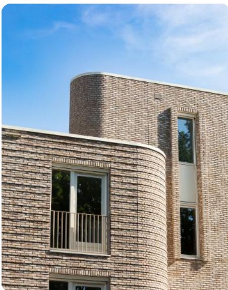
Bijzondere metselwerk verbanden

Dit project omvat een diversiteit aan woningen, waaronder seniorenappartementen, startersappartementen en studio's. Het bouwblok is opgebouwd met een middendeel bestaande uit vier lagen appartementen, terwijl aan de uiteinden drie lagen appartementen zijn gerealiseerd. Ruimte aan de linker- en rechterzijde van het gebouw is bewust vrijgehouden voor een groene inpassing. De afgeronde hoeken dragen bij aan een zachte uitstraling van het gebouw, versterkt door de keuze voor de metselsteen.