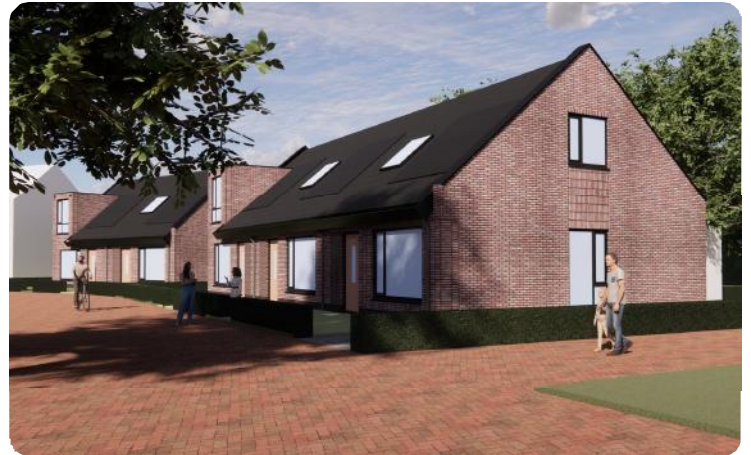
Ontwerp woningen aan de Koningin Wilhelminalaan

Deze aanpak garandeert dat de nieuwe bewoners kunnen genieten van duurzame, energiezuinige woningen met eigentijds comfort. De diversiteit aan woningtypen binnen het project zorgt ervoor dat er voor elke doelgroep een passende woonplek beschikbaar is. Het aanbod omvat zowel ruime als compacte eengezinswoningen, seniorenwoningen, studio's en appartementen, waarmee het project een inclusieve woonomgeving creëert die aan diverse behoeften tegemoet komt.