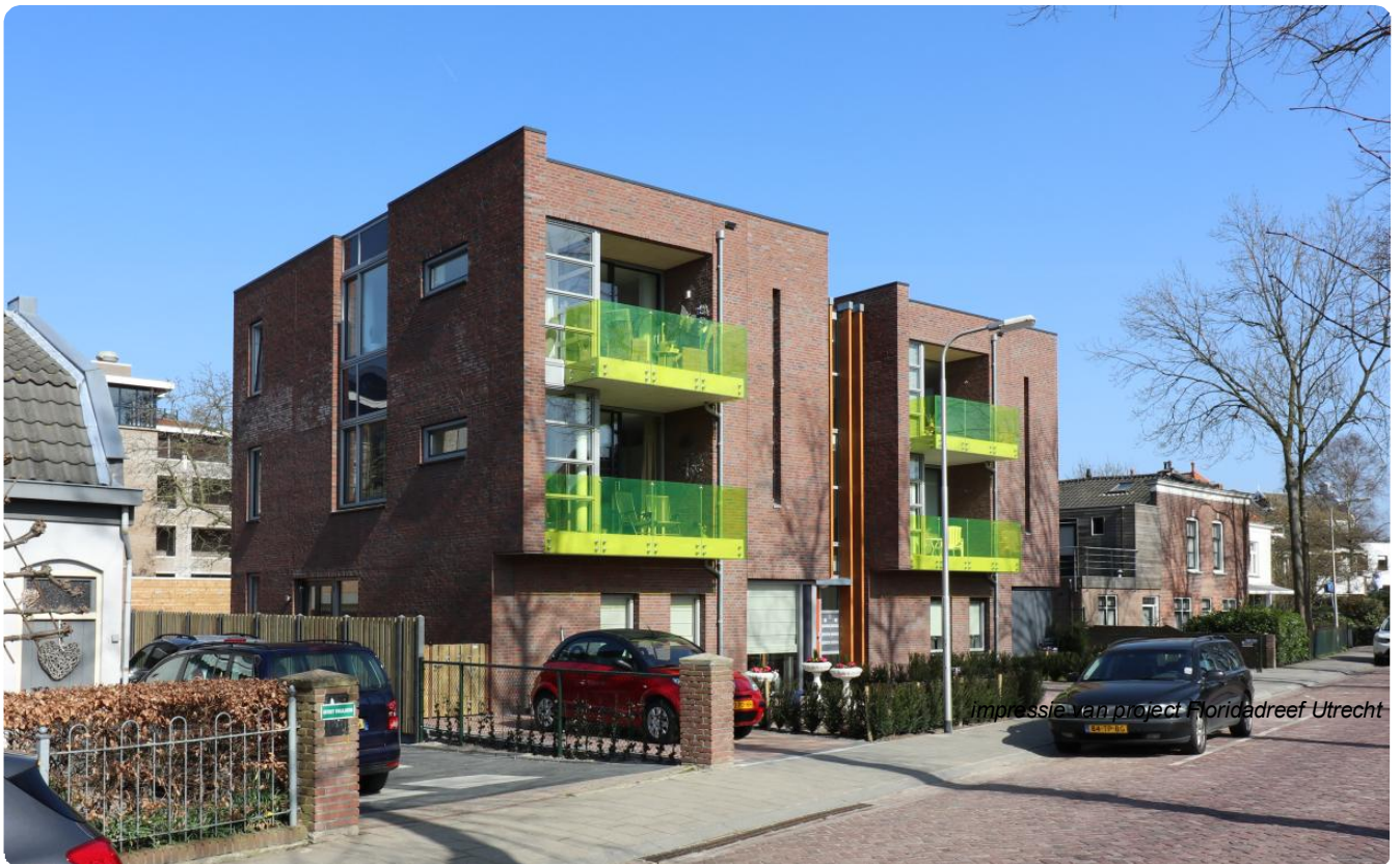
Impressie van project Floridadreef Utrecht

Tegen het centrum van Leerdam is een kleinschalig appartementencomplex gerealiseerd in opdracht van DAO projectontwikkeling. Het appartementencomplex is door Ter Braak Architecten ontworpen en bevat 6 appartementen, bergingen en parkeerplaatsen.