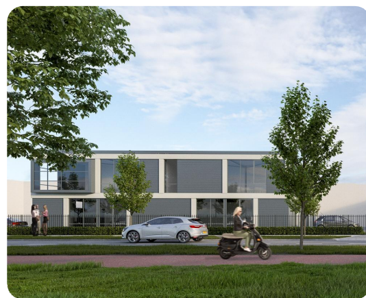
Artist Impressie nieuwbouw

De afgelopen tijd zijn door ons de uitvoeringstekeningen vervaardigd. Eind april zal het heiwerk starten, en naar verwachting zal in het 3e kwartaal van dit jaar de oplevering plaatsvinden.