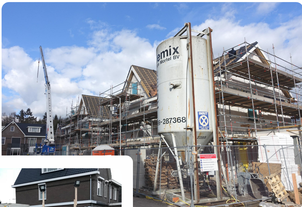
inmiddels zit de kap op de woningen

Inmiddels zit de kap op de woningen, en kunnen de pannen erop. Janssen de Jong verwacht medio 2018 de woningen op te kunnen leveren.