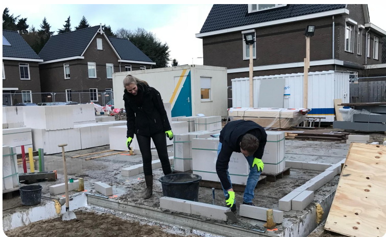
eerste steen gelegd door toekomstige bewoners

In Utrecht-Overvecht heeft Ter Braak Architecten in opdracht van Janssen de Jong Projectontwikkeling twee bedrijfspanden aan de Floridadreef ontworpen. Inmiddels is het merendeel van de bedrijfsruimten verkocht.