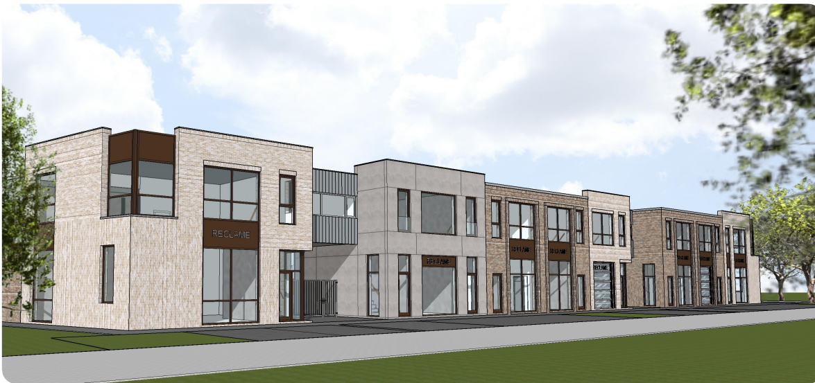
perspectief gevel Gabriël Metzstraat

Ter Braak Architecten heeft in opdracht van PIKE vastgoed uit Utrecht een ontwerp gemaakt voor een bedrijfsverzamelgebouw in Leiden. De locatie is gelegen aan de Gabriël Metzstraat in het Houtkwartier in Leiden, en vormt de overgang tussen woningbouw en een bedrijfslocatie. De gemeente stelde hoge eisen aan het uiterlijk van het gebouw, om een goede aansluiting met de omgeving te waarborgen. De uitstraling van het ontwerp wordt bepaald door de schakeling van individuele bouwblokken, met ieder een eigen materialisatie en vormgeving. De indeling (plattegrond) van de bouwblokjes wordt bepaald door de gebruiker. De bouwblokken aan de Metzstraat zijn vooral geschikt als hoogwaardige (kantoor) invulling, aan de binnenhoven ligt de nadruk op meer bedrijfsmatige invulling. Onlangs heeft de Commissie Welstand het ontwerp goed gekeurd, er was veel waardering voor het concept en de uitstraling. PIKE vastgoed zal het project binnenkort in verkoop brengen, waarna een spoedige realisatie verwacht wordt.